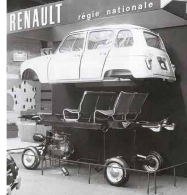
Die geniale Plattformstrategie setzt einen neuen Industriestandard.