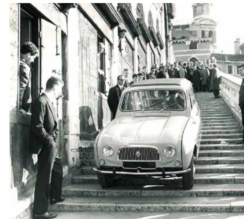
Kein Treppenwitz: Der Renault 4 entwickelt sich in kürzester Zeit zum französischen Bestseller par excellence.