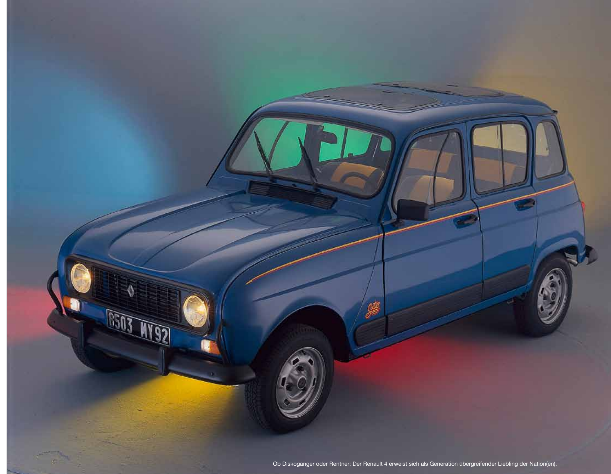
Ob Diskogänger oder Rentner: Der Renault 4 erweist sich als Generation übergreifender Liebling der Nation(en).