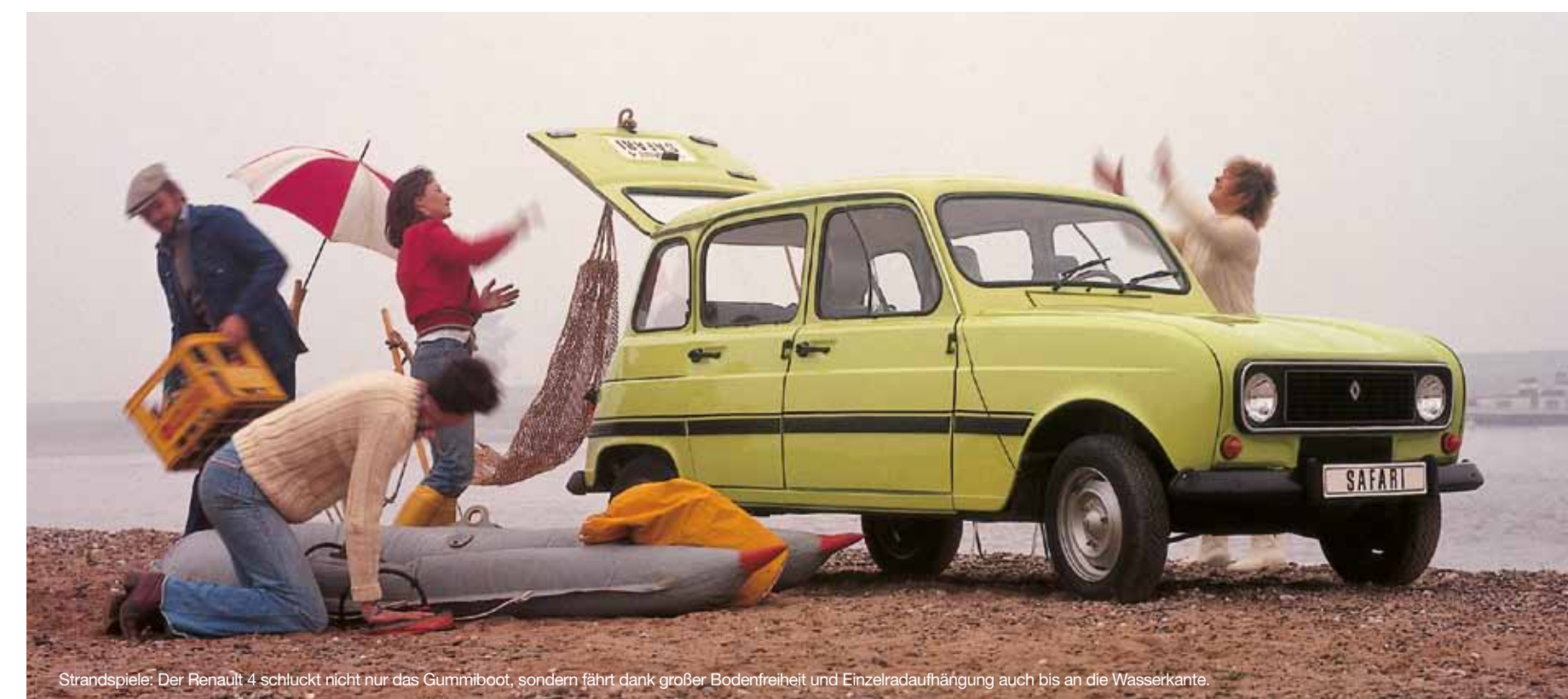
Strandspiele: Der Renault 4 schluckt nicht nur das Gummiboot, sondern fährt dank großer Bodenfreiheit und Einzelradaufhängung auch bis an die Wasserkante.