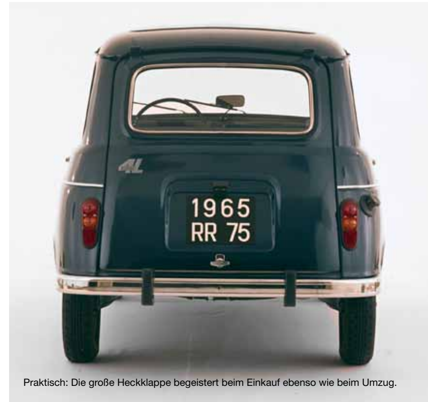
Praktisch: Die große Heckklappe begeistert beim Einkauf ebenso wie beim Umzug.

Möglich macht dies ein weiterer genialer Kniff: die vom Volksmund liebevoll „Revolverschaltung“ getaufte Schiebstock-Betätigung des Getriebes. Im R4 ließen sich schon vor 50 Jahren die erstmals vollsynchronisierten drei Gänge bequem wechseln – ohne die Hand weit vom Lenkrad entfernen zu müssen. Das erhöht ganz nebenbei auch die Verkehrssicherheit.