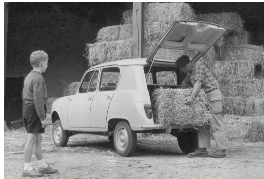
Transportprobleme unbekannt: Der Renault 4 schluckt auch das Abendmahl für das liebe Vieh.

Das Konzept erweist sich als so genial, dass über die Jahre kaum Modifikationen erforderlich sind: Fast unverändert läuft der R4 genau 31 Jahre lang vom Band. Exakt 8.135.424 Exemplare festigen den Ruf eines unverwüstlichen Bestsellers. Er wird in 28 Ländern gebaut und in mehr als 100 Staaten verkauft. Als meistverkauftes französisches Exportauto dient der R4 auch als wesentlicher Baustein für die beginnende Globalisierung von Renault. Studenten und Professoren lieben ihn gleichermaßen; er ist Möbelwagen und Liebeslaube, Familienkutsche und Nutzfahrzeug. Abenteuerer gehen mit ihm auf Weltreise – und kommen nach spektakulären Erlebnissen wohlbehalten wieder zu Hause an. Selbst im Rallyesport, nicht unbedingt als Domäne für den eher schwachbrüstigen Vierzylinder zu erwarten, schlägt sich der R4 wacker. Sein Debüt im Motorsport feiert er bei der Rallye Monte Carlo 1962. Sogar den legendären Wüsten-Marathon Paris–Dakar absolviert der Fünftürer klaglos – und wird Zweiter des Gesamtklassements. Der französische Komiker Jacques Tati setzt ihm im Kinoerfolg „Trafic“ ein filmisches Denkmal und zeigt einen praktischen Zusatznutzen: Auf dem heruntergeklappten Kühlergrill lässt sich im Stau eine warme Mahlzeit bruzzeln.