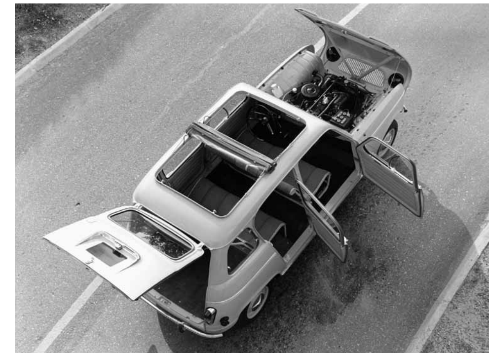
Renault 4 öffne dich: Der praktische Kompaktwagen bietet Passagieren und Gepäck bequemen Zugang – und mit optionalem Faltdach reichlich Frischluft.

Frankfurt, 21. September 1961. Die Autowelt pilgert zur Internationalen Automobil ausstellung an den Main. Ausgerechnet hier, wo man Kompaktklasse mit Käfer übersetzt, schiebt Renault einen absolut ungewöhnlichen Kleinwagen ins Rampenlicht. Der schlicht „R4“ getaufte Neuling ist revolutionär anders als seine Zeitgenossen und diesen in vielerlei Hinsicht weit voraus. Der R4 ist die weltweit erste Kombi-Limousine mit vier Türen, großer Heckklappe, geräumigem Gepäckabteil und variablem Innenraum. Vor 50 Jahren setzt er mit diesem Konzept Maßstäbe und kreiert einen Industriestandard, der in den Grundzügen bis auf den heutigen Tag Bestand hat. Der R4 ist auch der erste Renault-Pkw mit Frontantrieb. Damit etabliert er die heute dominierende Antriebsart aller Pkw-Modelle der Marke.