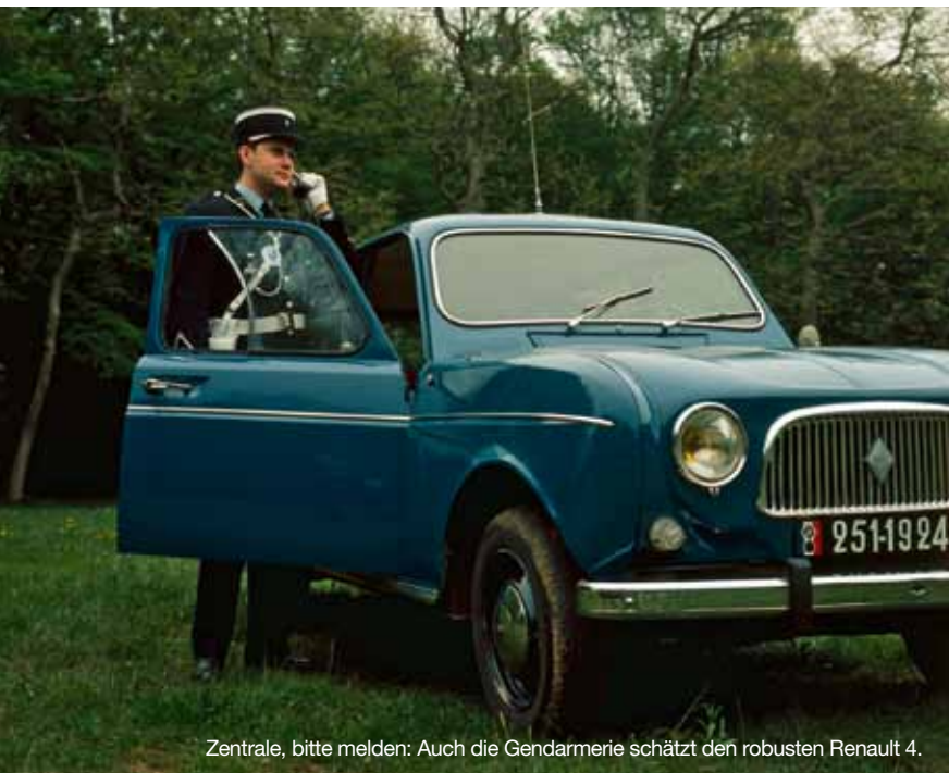
Zentrale, bitte melden: Auch die Gendarmerie schätzt den robusten Renault 4.