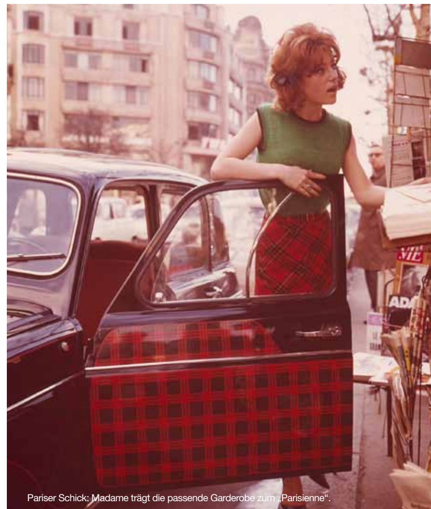
Pariser Schick: Madame trägt die passende Garderobe zum „Parisienné“.