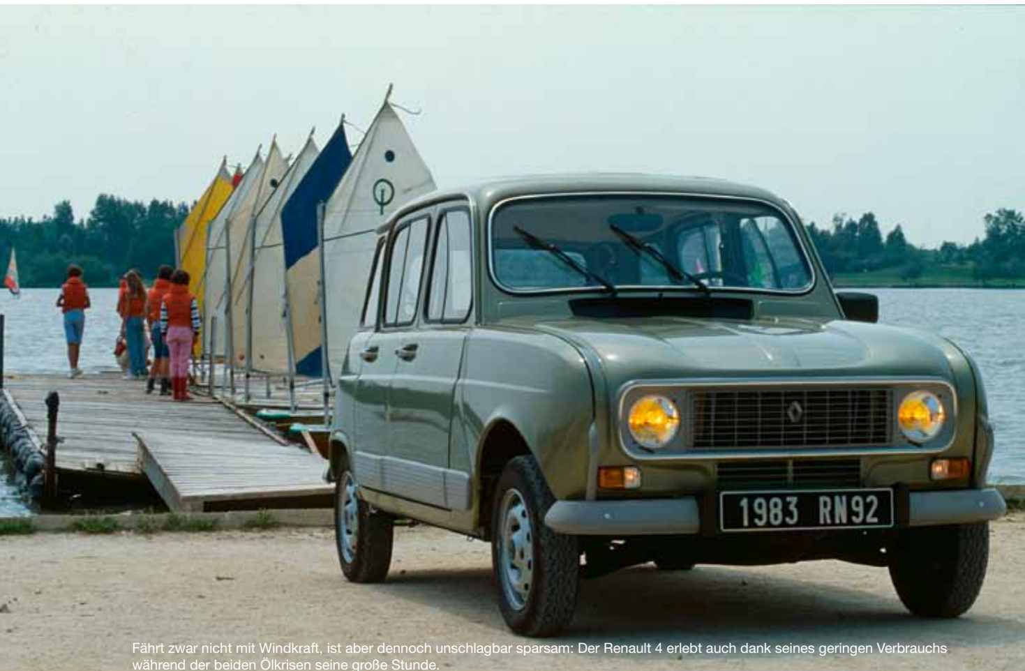
Fährt zwar nicht mit Windkraft, ist aber dennoch unschlagbar sparsam: Der Renault 4 erlebt auch dank seines geringen Verbrauchs während der beiden Ölkrisen seine große Stunde.

Doch damit ist die Renault 4 Story noch lange nicht zu Ende. Auch zwei Jahrzehnte später lebt der fortschrittliche Franzose fröhlich weiter, jetzt oft aufwendig restauriert und sogar mit einem geregelten Katalysator für optimale Abgasreinigung bestückt. Er macht auf Oldtimer-Fernfahrten ebenso eine gute Figur wie bei der strapaziösen 4L Trophy von Paris nach Marrakesh. In jedem Fall erweist er sich als alltagstauglich, leicht zu reparieren und günstig zu unterhalten – wie vor 50 Jahren.