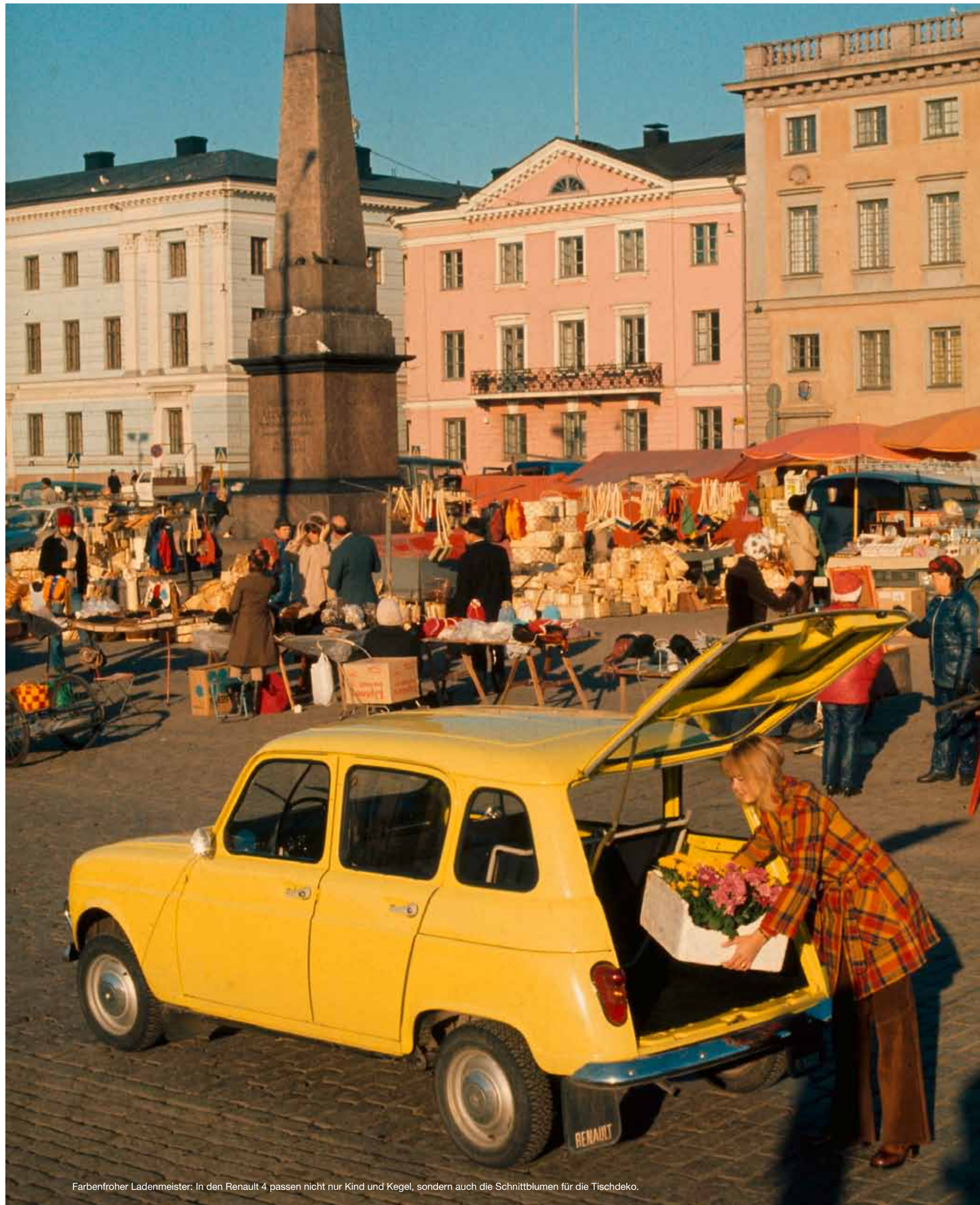
Farbenfroher Ladenmeister: In den Renault 4 passen nicht nur Kind und Kegel, sondern auch die Schnittblumen für die Tischdeko.