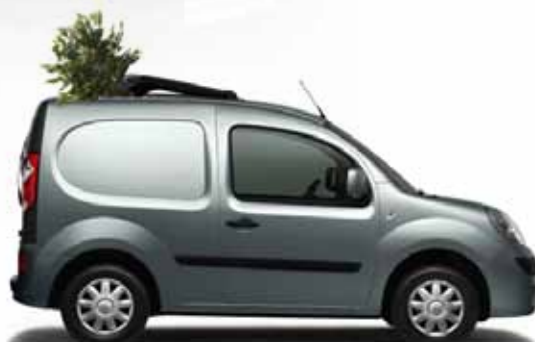
KANGOO COMPACT MIT DACHLADEKLAPPE