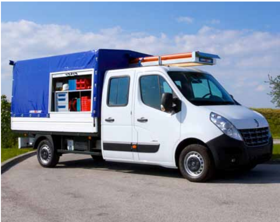
Master Fahrgestell Doppelkabine mit Pritsche und LogicLine-Umbau