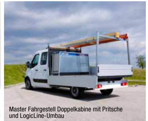
Master Fahrgestell Doppelkabine mit Pritsche und LogicLine-Umbau