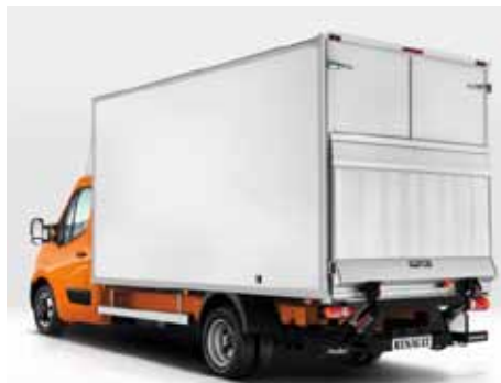
Master Fahrgestell mit Kofferaufbau und Ladebordwand