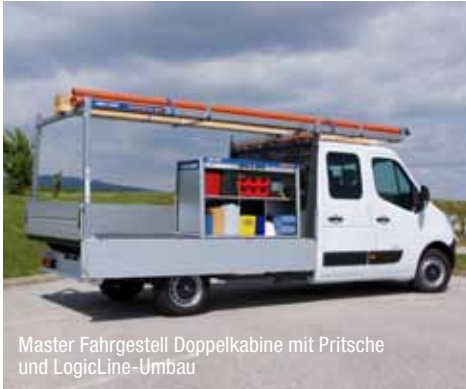
Master Fahrgestell Doppelkabine mit Pritsche und LogicLine-Umbau

Ob Pferdetransporter, Frischdienst oder Lieferwagen mit Ladebordwand – sollten Sie über die Renault Werkslösungen hinaus individuelle Wünsche haben, setzen wir diese gemeinsam mit unseren verlässlichen Partnern in die Tat um. In Zusammenarbeit mit den Spezialisten Hödlmayr, Scheuwimmer, Dlouhy oder LogicLine bieten wir Nutzfahrzeuge, die zu 100 % auf Ihre Anforderungen zugeschnitten sind. Nähere Informationen erhalten Sie bei Ihrem Renault Partner.