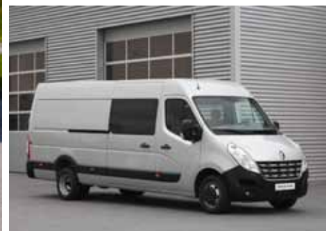
Master Kastenwagen Doppelkabine