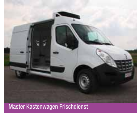
Master Kastenwagen Frischdienst